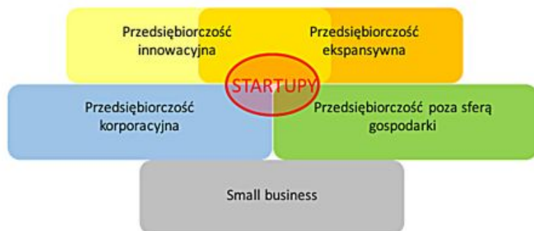
Rys. 1. Startupy na tle współczesnych form przedsiębiorczości